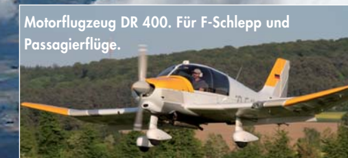
Motorflugzeug DR 400. Für F-Schlepp und Passagierflüge.

Foto oben: Zweisitzer DG 505 Elan, Leistungsflugzeug für den Streckenflug, Höchstgeschwindigkeit 270 km/h.