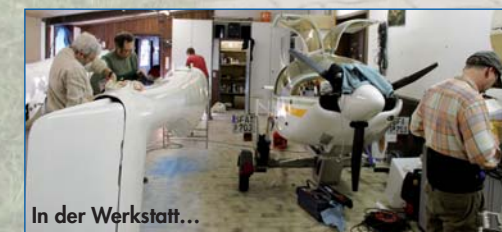
In der Werkstatt...

Es gibt jeden Winter viel zu tun, damit wir zur neuen Saison im Frühjahr den Flugbetrieb wieder sicher durchführen können.