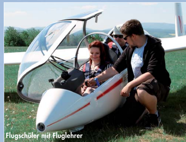
Flugschüler mit Fluglehrer

NEIN! Der Aero-Club hat eine große Flotte. Die Flugzeuge stehen für die Ausbildung, Spazierflüge und Wettbewerbe zur Verfügung und sind so modern, dass sie auch bei internationalen Meisterschaften konkurrenzfähig sind.