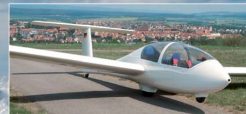
Foto links oben: Grob G 102 Club, Übungseinsitzer für Flugschüler, auch für kleinere Streckenflüge geeignet, Höchstgeschwindigkeit 250 km/h.

Foto links: Doppelsitzer »Twin«, Grob 103, Schulflugzeug, Passagierflugzeug, Höchstgeschwindigkeit 250 km/h.