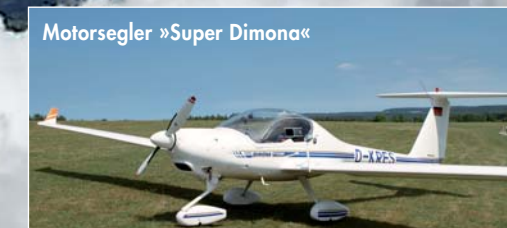
Motorsegler »Super Dimona«