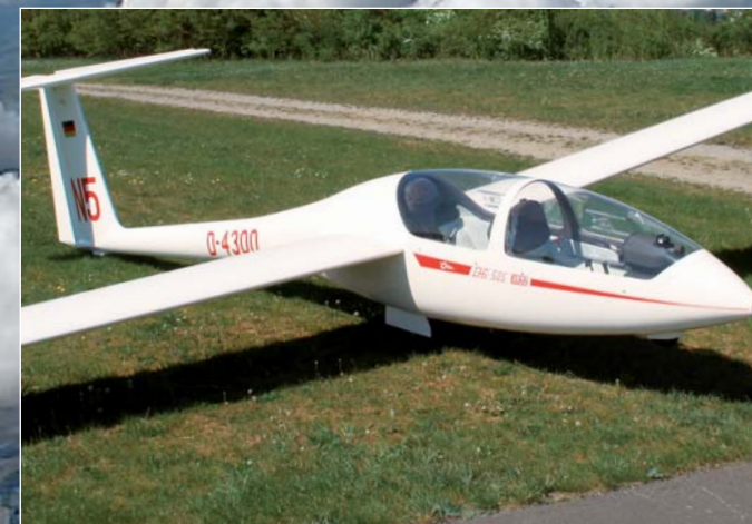
Foto oben: Zweisitzer DG 505 Elan, Leistungsflugzeug für den Streckenflug, Höchstgeschwindigkeit 270 km/h.

Foto links: Doppelsitzer »Twin«, Grob 103, Schulflugzeug, Passagierflugzeug, Höchstgeschwindigkeit 250 km/h.