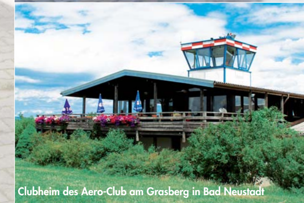
Clubheim des Aero-Club am Grasberg in Bad Neustadt

Der Sonderlandeplatz Bad Neustadt ist aufgrund der verkehrsgünstigen Lage idealer Ausgangspunkt für Halbtags- und Tagesausflüge.