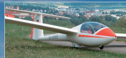
Ka 8 Oldtimer, Übungseinsitzer, Höchstgeschwindigkeit 190 km/h.

Im Aero-Club Bad Neustadt stehen derzeit 4 Segelflugzeuge, 1 Motorsegler und 1 Motorflugzeug für Ausbildung und Streckenflüge zur Verfügung.